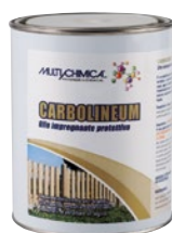
Art. 2245 CARBOLINEUM

Soluzione sgrassante indicata per eliminare residui di calce e cemento. Formulato con matrice acida, può essere applicato su pavimenti ad uso industriale oppure realizzati con cotto o piastrelle in ceramica ed altri materiali.