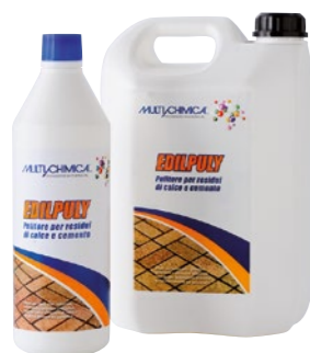
Art. 2D00 EDILPOLY pulitore per residui di calce cemento

Miscela di resine a base solvente, con funzione idrorepellente (e ritardante l'assorbimento di oli) nel trattamento di cotto, klinker, gres, cemento e pietre naturali. Penetra nelle fessurazioni legandosi con i materiali, consolidandoli e proteggendoli da infiltrazioni. Trasparente con effetto naturale, non ingiallisce (non altera né l'estetica né la traspirabilità delle superfici), prevenendo la percolazione dell'acqua e riducendo la formazione di muffe ed efflorescenze. Pronto uso, agitare prima di applicarla sulla superficie perfettamente pulita e asciutta mediante pennello, tampone, spruzzo con irroratore a bassa pressione e rullo. Asciuga completamente in 24 ore.