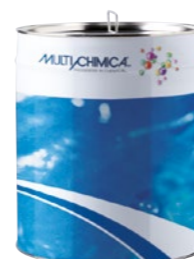
Art. 2290 EDILDISARMO disarmante

Lattice additivo a base di resine sintetiche elastomeriche studiato per migliorare le caratteristiche meccaniche e di adesione degli impasti cementizi, diminuendone il tempo di presa e l'assorbimento d'acqua. Il prodotto, additivato agli impasti, ne migliora l'aderenza a tutti i supporti, la flessione, la resistenza all'abrasione ed ai cicli di gelo e disgelo e ne aumenta la resistenza chimica. Impiegato come additivo per massetti esterni, intonaci ad alta resistenza, boiacche cementizie, malte antiritiro e rasature a basso spessore.