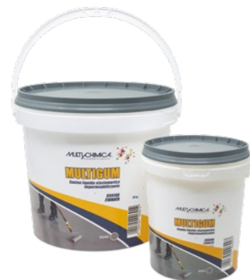
Art. 2262 Multigum fibrato grigio Art. 2263 Multigum fibrato rosso

Rivestimento impermeabilizzante elastomerico monocomponente in dispersione acquosa che, una volta essiccata, forma una membrana resistente, elastica ed impermeabile che aderisce perfettamente ai supporti sui quali è applicata. Presenta gli stessi caratteri di applicabilità di Multigum pedonabile.