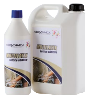
Art. 2291 MULTILUTEX

Soluzione da distribuire prima della tinteggiatura di superfici murali, interne o esterne, per un ottimo risultato aggrappante e regolatore dell'assorbimento. A base di resine acriliche in dispersione acquosa, è inodore e non presenta particolari rischi per la salute. Grazie alle sue specifiche caratteristiche, può utilizzarsi non solo su pareti esterne, ma anche in ambienti chiusi o poco areati. La sua posa è compatibile con superfici dipinte o al grezzo, sia con intonaci vecchi sia nuovi. Pronta all'uso, ma diluibile da 1:1 a 1:4 (una parte di prodotto e 4 parti di acqua) a seconda dell'assorbimento del supporto, per evitare vetrificazione.