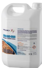
Art. 2212 MUROSAN-IDRO

Impregnante idrorepellente incolore a base di resine silossaniche e si usa per la protezione di superfici verticali o inclinate (facciate) in calcestruzzo a vista, intonaci cementizi, mattoni da rivestimento a vista e pietre naturali. È caratterizzato da una elevata capacità di penetrazione in tutti i materiali minerali assorbenti impiegati in edilizia, non filmogeno e quindi permette sia traspirabilità che permeabilità dei supporti e non altera l'estetica.