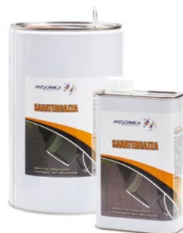
Art. 2218 SANATERAZZA protettivo, consolidante, traspirante, anti-infiltrazioni

Multicolor è una pittura monocomponente a base di resine in dispersione acquosa che, una volta essiccata, forma una pellicola resistente, elastica ed impermeabile che aderisce perfettamente ai supporti sui quali è applicata. Multicolor trova impiego nel rivestimento e la protezione di impermeabilizzazioni costituite da manti bituminosi a caldo con bitume ossidato e a freddo con emulsioni bituminose stabilizzate o da membrane bitume polimero calcate, sabbie e ardesiate.