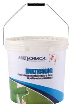
Art. 2411 Multicolor rosso Art. 2412 Multicolor grigio Art. 2413 Multicolor verde Art. 2414 Multicolor bianco

Rivestimento impermeabilizzante elastomerico monocomponente in dispersione acquosa che, una volta essiccata, forma una membrana resistente, elastica ed impermeabile che aderisce perfettamente ai supporti sui quali è applicata. Presenta gli stessi caratteri di applicabilità di Multigum pedonabile.