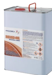
Art. 2216 EDILSAN-SOL

Disarmante speciale emulsionabile in acqua per applicazioni su casseri o pannelli in legno o diluibile in solvente per casseri metallici. È un prodotto a base di olii speciali, additivi ed emulsionanti con proprietà antiadesive per un facile e rapido risarmo dei getti di calcestruzzo, migliorandone anche l'aspetto estetico.