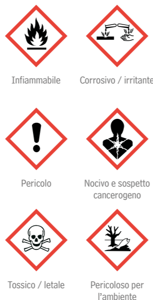
Inflammabile Corrosivo / irritante