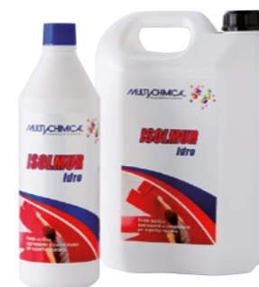
Art. 2217 ISOLMUR IDRO fondo acrilico aggrappante

Cartoni 6 pz 750 ml Cartoni 4 pz 5 lt Secchi 20 lt